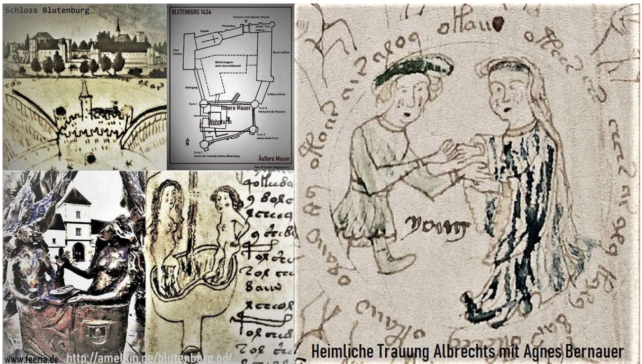
Heimliche Trauung Albrechts mit Agnes Bernauer

The consciousness of a person (for example, a guest or a resident of the Blumenburg Castle) with its subsystems is a subsystem of the consciousness of the Blumenburg Castle, which is a subsystem of the Consciousness of the Universe with the creative possibility of exchanging information between all subsystems, including subsystems remained from the past. If a person masters the technologies of green fog (smog) and the systematic approach subalgorithm SOSSS ( stop - observe - smog - solution - step ), then it will be able to connect to any subsystem of consciousness and self-consciousness (for example, the Blumenburg Castle) and to solve any problems. The formation of special cultural and creative skills allows a person unlimitedly to develop its extrasomatic pampsy-structure of consciousness and self-consciousness connected with the Consciousness and the Long-term Memory of the Universe.